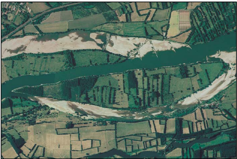
Orthophotographies IGN - 1999