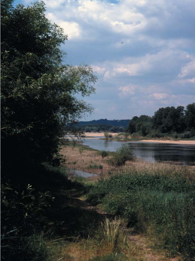
Conservatoire régional des rives de la Loire et de ses affluents, juin 1995