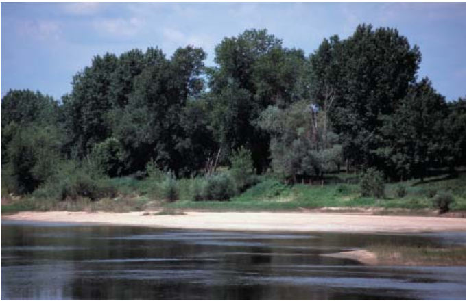
Conservatoire régional des rives de la Loire et de ses affluents, juin 1995