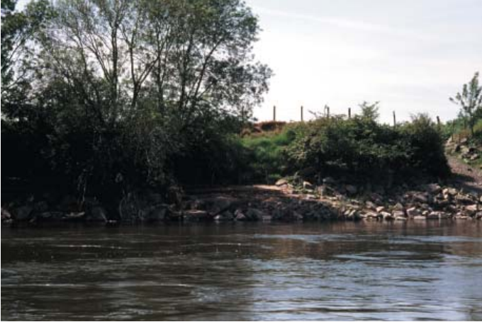
Conservatoire régional des rives de la Loire et de ses affluents, avril 1994