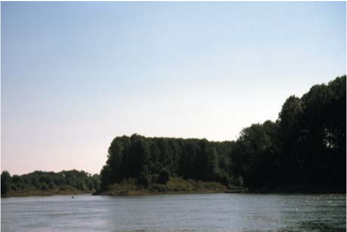
Conservatoire régional des rives de la Loire et de ses affluents, juillet 1988

Région : Pays de la Loire Département : Loire-Atlantique et Maine-et-Loire Commune : Ancenis (44) et Drain (49)