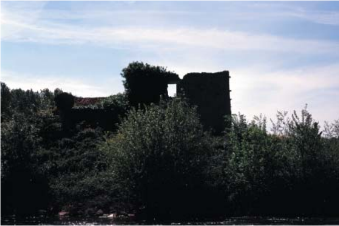
Conservatoire régional des rives de la Loire et de ses affluents, novembre 2003