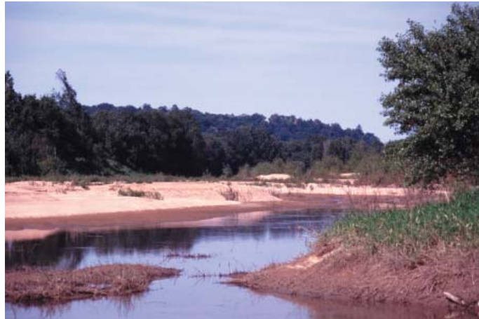
Conservatoire régional des rives de la Loire et de ses affluents, juin 1994

Région : Pays de la Loire Département : Loire-Atlantique et Maine-et-Loire Commune : Le Cellier (44) et La Varenne (49)