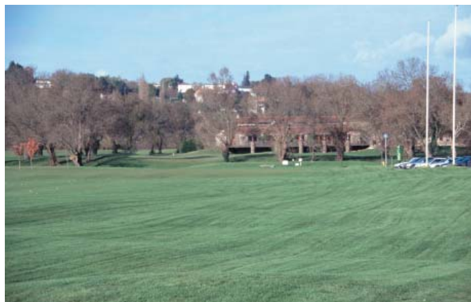
Conservatoire régional des rives de la Loire et de ses affluents, novembre 2000