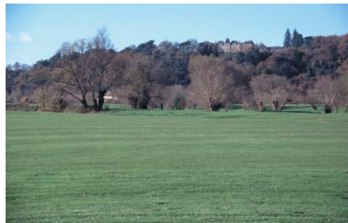
Conservatoire régional des rives de la Loire et de ses affluents, novembre 2000