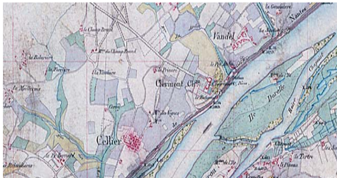
Carte de Coumes 1863