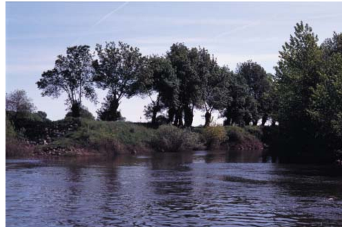
Conservatoire régional des rives de la Loire et de ses affluents, juin 1994