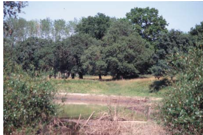
Conservatoire régional des rives de la Loire et de ses affluents, juin 1994