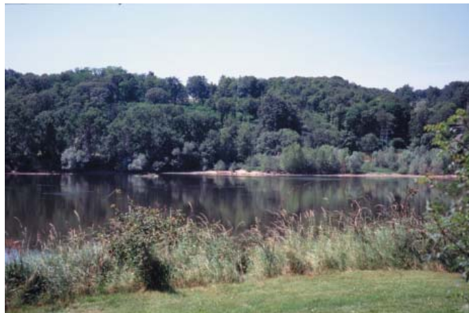
Conservatoire régional des rives de la Loire et de ses affluents, juin 1994