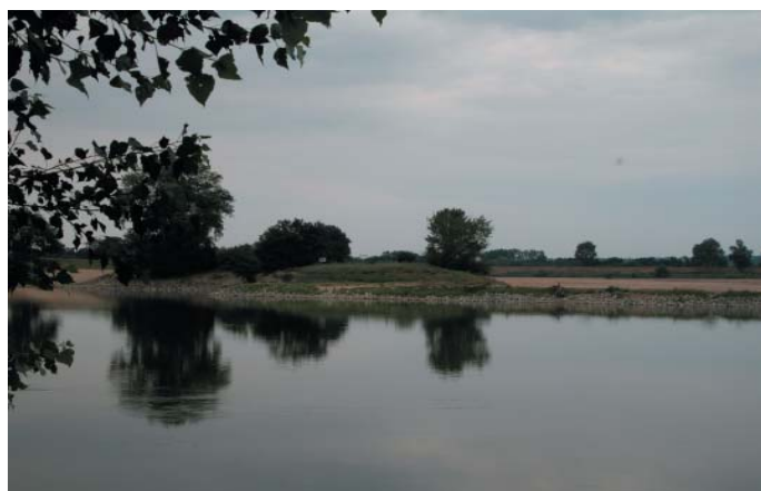
Conservatoire régional des rives de la Loire et de ses affluents, juillet 2005