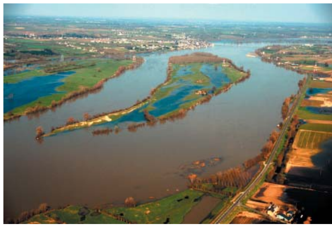
D.Drouet, mars 1995