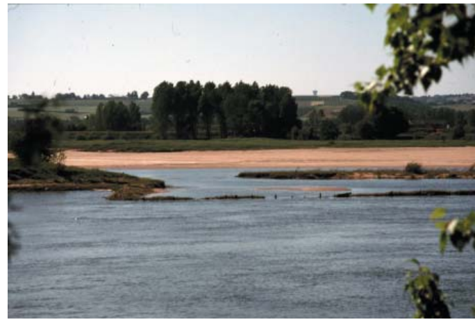
Conservatoire régional des rives de la Loire et de ses affluents, mai 1998