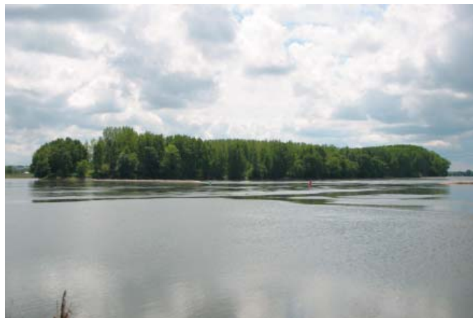
Conservatoire régional des rives de la Loire et de ses affluents, mai 2005