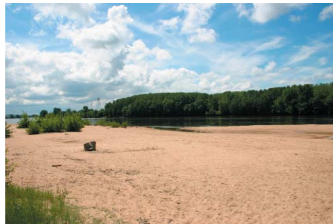
Conservatoire régional des rives de la Loire et de ses affluents, mai 2005