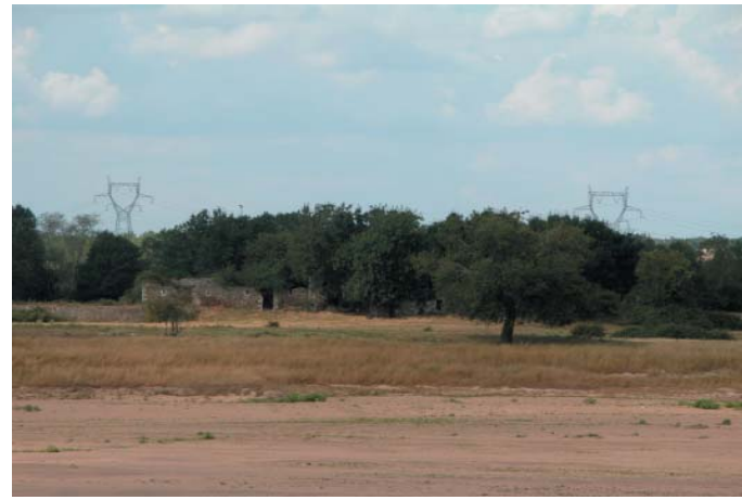
Conservatoire régional des rives de la Loire et de ses affluents, août 2004