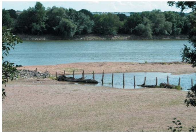
Conservatoire régional des rives de la Loire et de ses affluents, août 2004