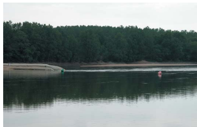
Conservatoire régional des rives de la Loire et de ses affluents, juillet 2005