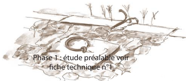
Phase 1 : étude préalable voir fiche technique n°1